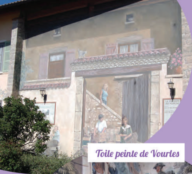
Toile peinte de Vourles