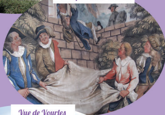
Vue de Vourles